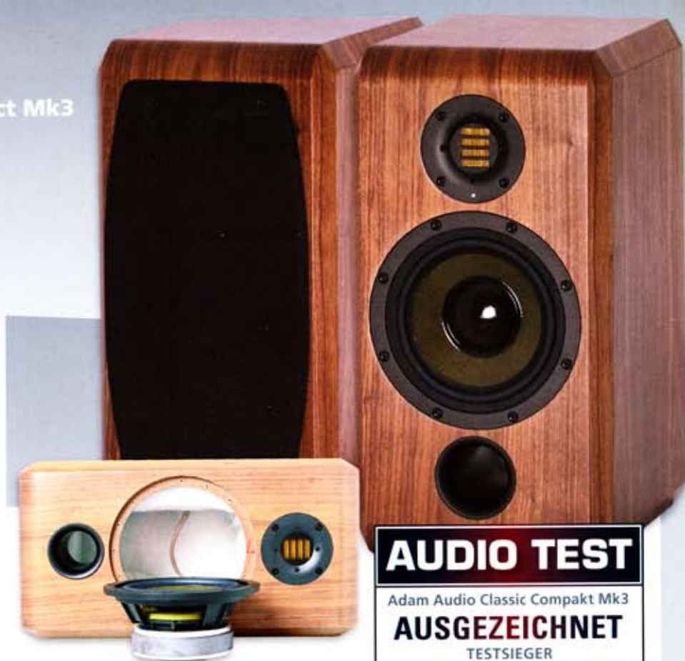
Ein Blick in das Innere zeigt eine sehr gute Dämmung und den kraftvollen Antrieb des Tiefmitteltöners

Auch der 186 Millimeter (mm) große Tiefmitteltöner birgt Spezielles: Das Membranmaterial wird Hexacone genannt. Aufgebaut ist er aus einer Sandwich-Membran aus Nomexwaben (den Bienenwaben entlehnt) mit einer beidseitigen Kevlarbeschichtung. Die klanglichen Vorteile liegen in einem sehr linearen Übertragungsverhalten und einer hohen Dämpfung von ungewünschten Partialschwingungen. Eine besonders getreue und nicht überzogene Reproduktion von Bässen und Tiefmitten ist das Ziel des Aufwandes. Da wird es auch völlig belanglos, dass der Antrieb konventionell erfolgt. Dafür scheint eine hohe Belastbarkeit möglich, denn eine Polkernöffnung sorgt für eine zusätzliche Schwingspulenbelüftung. Der Compact Mk3 ist nicht magnetisch abgeschirmt, was aber in Zeiten von neuen Bildschirmen nicht so tragisch ist. Im Programm von Adam Audio befinden sich alle Lautsprechervarianten, die für den Aufbau eines Surround-Sets nötig sind – und das mit einem gleichbleibenden Klangcharakter. Die akustischen Gehäuseeigenschaften sind tadellos: Wir konnten weder ausgeprägte Gehäuseresonanzen noch schwingende Seitenwände feststellen. Im Inneren entdeckten wir neben der beein-