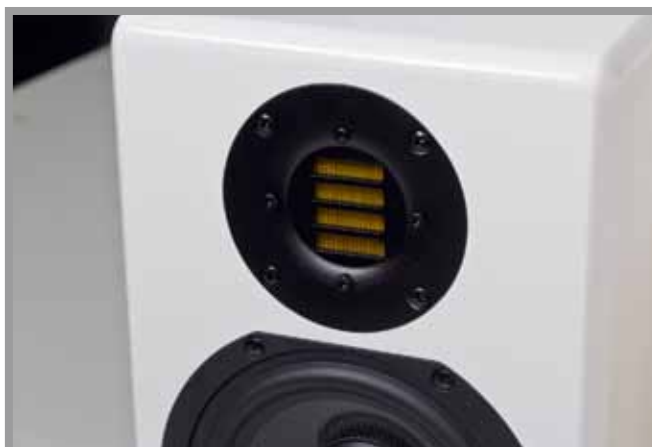
Der gelb schimmernde Ziehharmonika-förmige Folienhochtöner ist das Markenzeichen von Lautsprechern aus dem Hause ADAM

Bässen sowie in den Tiefmitten eine gute Durchsetzungsfähigkeit. Das ausgezeichnete Impulsverhalten sorgt für den nötigen Druck. So klingen Bassdrums und abgestoppte Basslinien differenziert. Aber auch einem legato gespielten Kontrabass wird der Lautsprecher durchaus gerecht. Die Mitten erscheinen über ihr gesamtes Spektrum klar aufgelöst und zeigen keinerlei Auffälligkeiten. Hier wird nichts geschönt, nichts verfärbt, sondern alles schnurgerade wiedergegeben. Eine ausgezeichnete Tiefenstaffelung hebt Instrumente und Instrumentengruppen gut voneinander ab. Die wahre Stärke der Schallübertrager aus der Hauptstadt liegt jedoch im Obertonbereich. Hier wird jedes noch so kleine Detail erfasst und