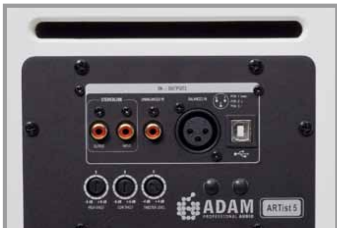
Fein säuberlich staffeln sich an der Rückseite der ARTist 5 die Eingänge und darunter die Bedienelemente