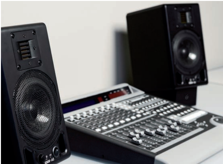
Les dimensions de ces moniteurs sont réduites : 17 x 28 x 20 cm, pour un poids de 5 kg.