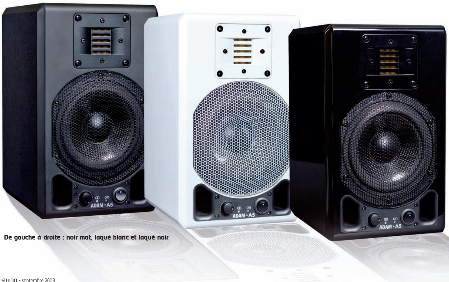
De gauche à droite : noir mat, laqué blanc et laqué noir

assortie à un iPod ! Et les supports assortis pour bureau sont à 55 euros les deux. Autrement dit, les A5 sont destinées à ceux qui utilisent leur ordinateur comme source sonore, au sens large du terme... Les photos du carton représentent d'ailleurs les enceintes posées près d'un iMac, reliées à un iPod, ou encadrant une surface de contrôle, mais aussi près d'une console de jeux et d'un lecteur de CD. Fort bien, mais dans ce cas, pourquoi ne pas aller jusqu'au bout, en proposant une liaison via USB ?